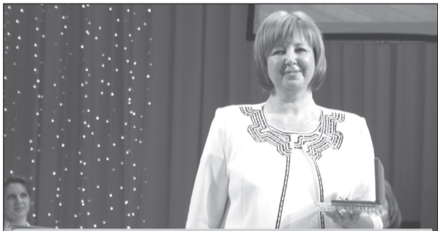
ВАЖНО, ЧТО ДЕТИ ПОНЯЛИ ИЗ УРОКА