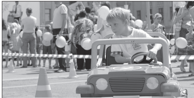
ДОРОГА НЕ ТЕРПИТ ОШИБОК